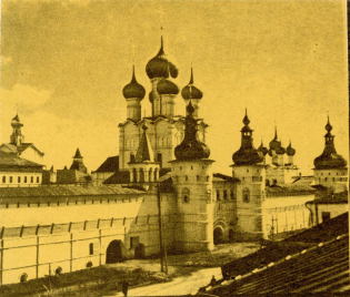
Ростовский кремль. Вид с юга

тесной связи его архитектуры с древним белокаменным зодчеством. И эти традиции собор не только сберег в своих формах, но и передал стронтелям Ростовского ансамбля.