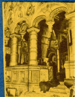
Церковь Спаса-на-сенях. Солея