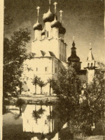
Церковь Иоанна Богослова

ству с московской Грановитой палатой, Белая палата получила широкую известность: ее своды также поддерживаются центральным столпом. Когда-то весь интерьер был расписан фресками, но они не сохранились. Под столовой в нижнем этаже помещалась большая «поваренная». В Белой палате «владыка ставил стол», то есть угощал «высоких» гостей.