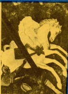
Церковь Воскресения. Фреска