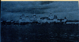
Вид с озера

В величественном облике Ростовского собора заметно влияние Успенского собора Московского кремля. В то же время монументальные формы и план кирпичного храма, белокаменный цоколь и богатый декор убедительно говорят о