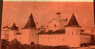
Вид с севера

На Соборной площади, несколько восточнее собора, в конце XVII века была построена высокая четырехпролетная звонница. Ее монументальный, строгий облик с массивной фасадной плоскостью и высоко поднятой галереей звона, вся архитектурная обработка фасадов прекрасно сочетаются с архитектурой древнего собора. Колокола ростовской звонницы и их оригинальные мелодии звона славились в течение трех